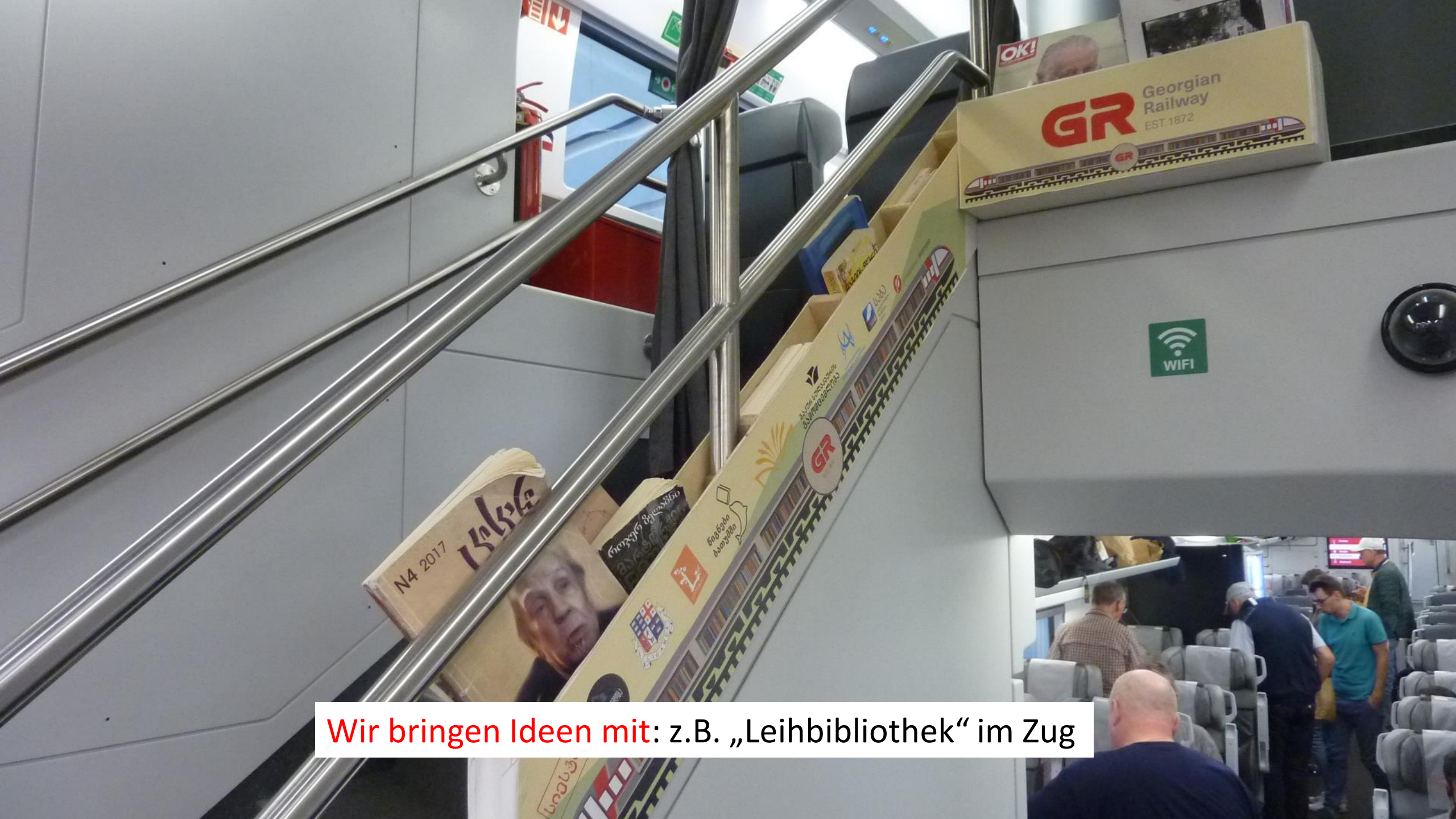
Wir bringen Ideen mit: z.B. „Leihbibliothek“ im Zug