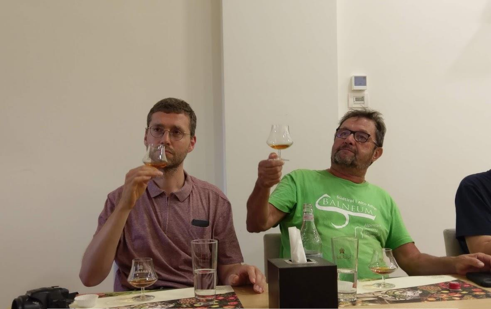
Neuem immer aufgeschlossen: Verkostung des Ararat-Cognacs in Yerevan