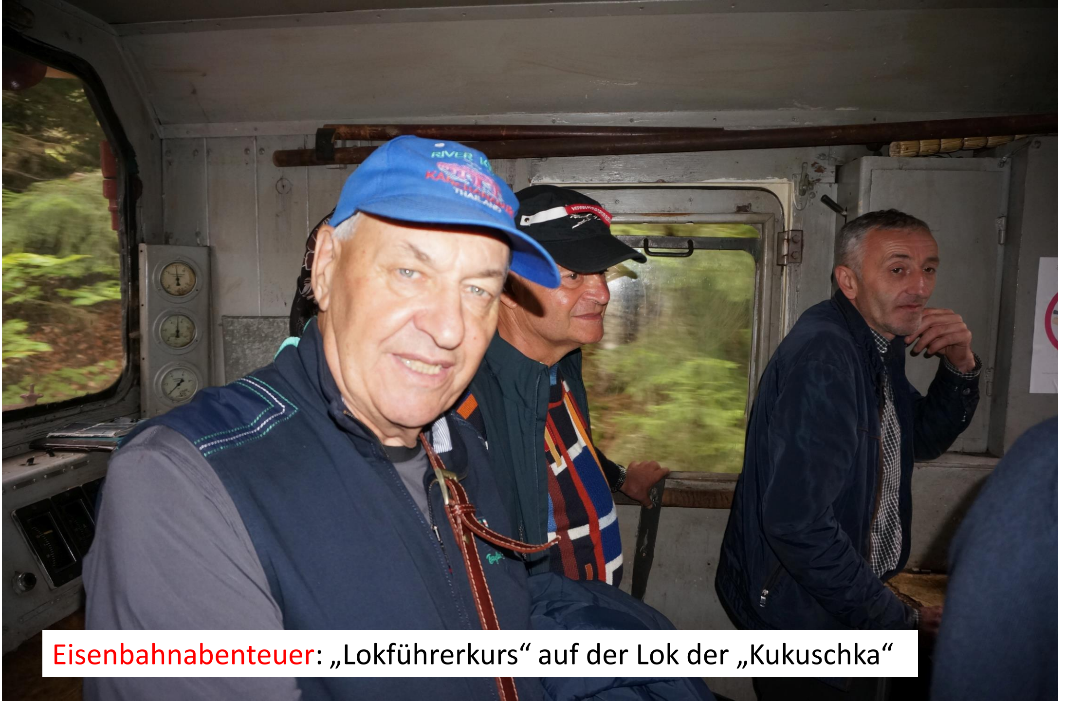
Eisenbahnabenteuer: „Lokführerkurs“ auf der Lok der „Kukuschka“