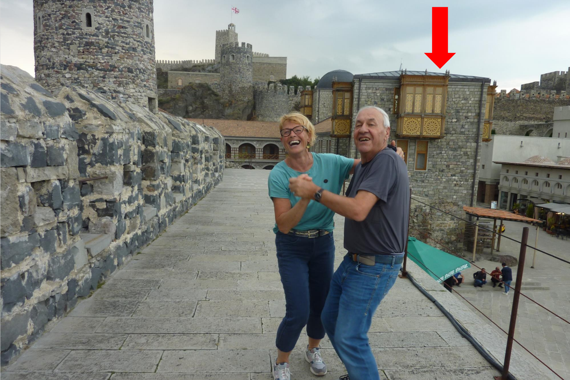
Festung Alchaziche, Georgien: immer gute Hotels! Und immer a „a Hetz“