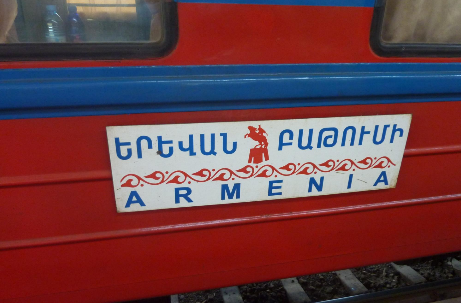
Fördern der Bahn in Regionen, wo sie bedroht ist: Zug Batumi - Yerevan