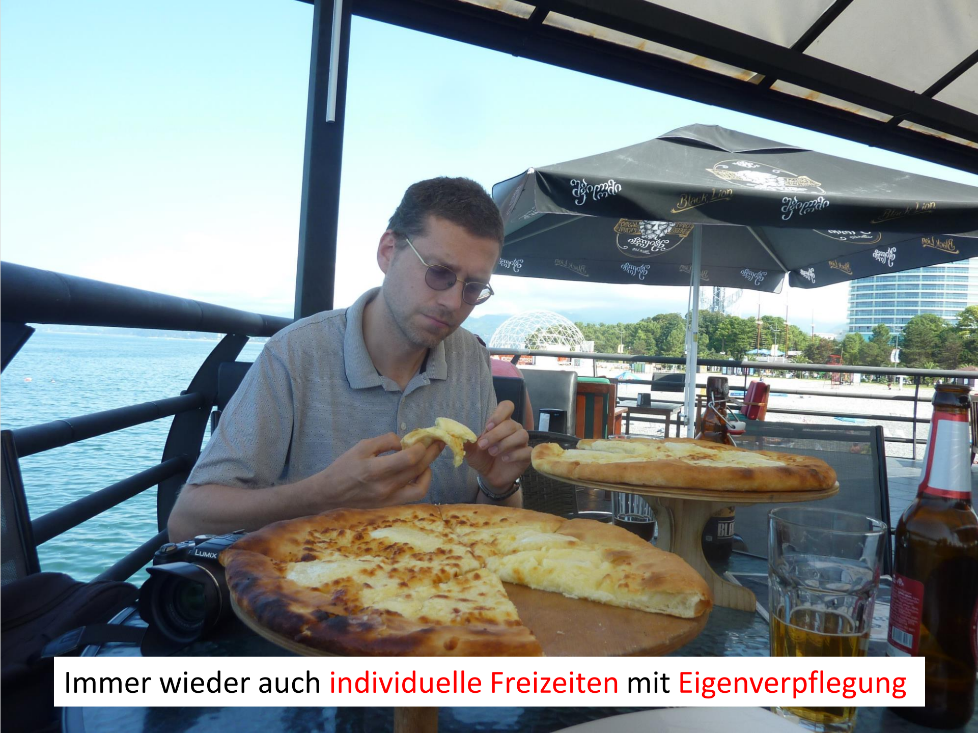
Immer wieder auch individuelle Freizeiten mit Eigenverpflegung