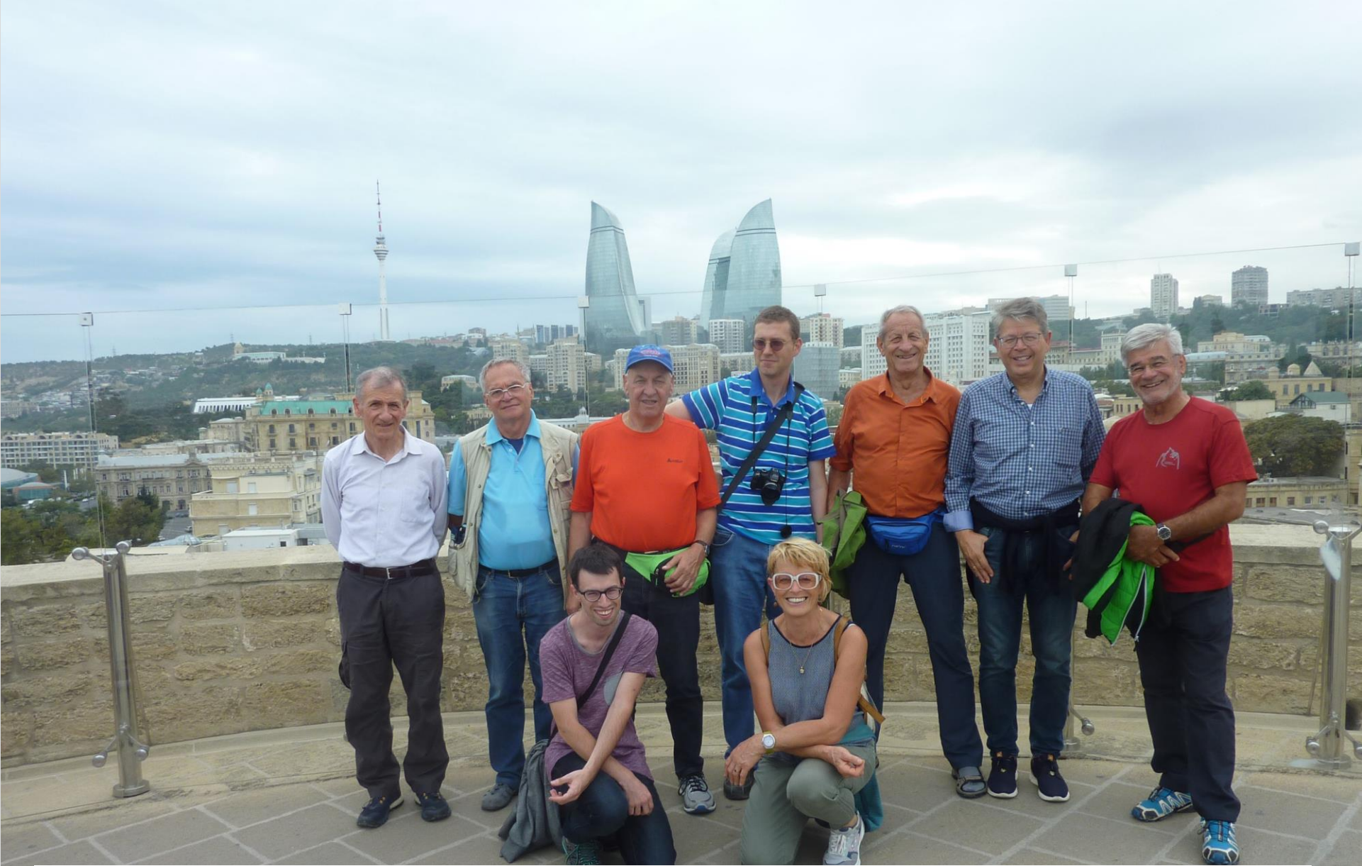
Feinstes Kulturprogramm (1): Besichtigung in Baku, Flammentürme, Hauptstadt Aserbaidshan.