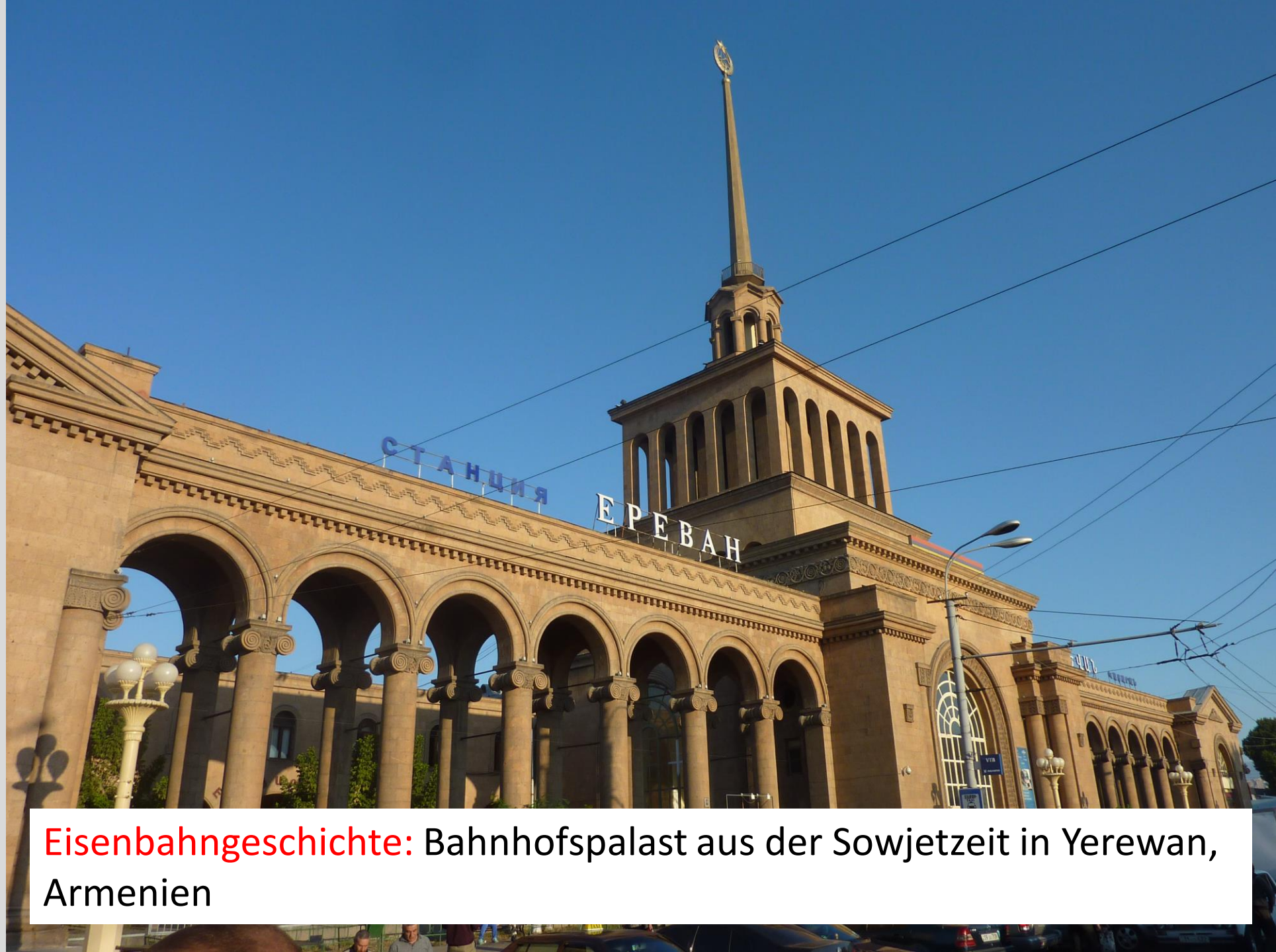
Eisenbahngeschichte: Bahnhofspalast aus der Sowjetzeit in Yerevan, Armenien