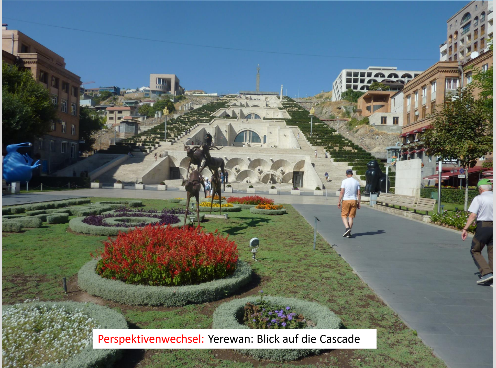
Perspektivenwechsel: Yerevan: Blick auf die Cascade