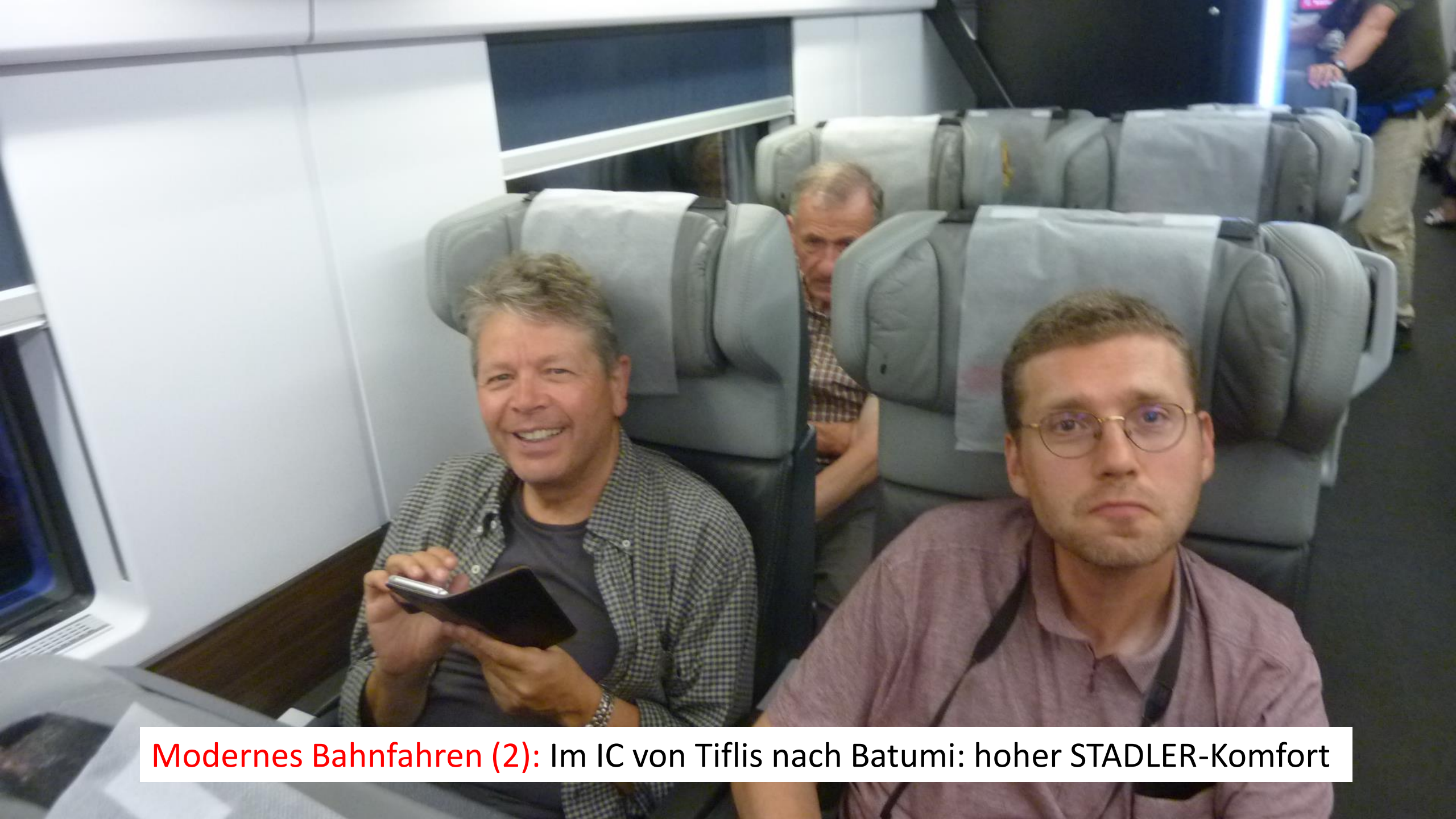
Modernes Bahnfahren (2): Im IC von Tiflis nach Batumi: hoher STADLER-Komfort