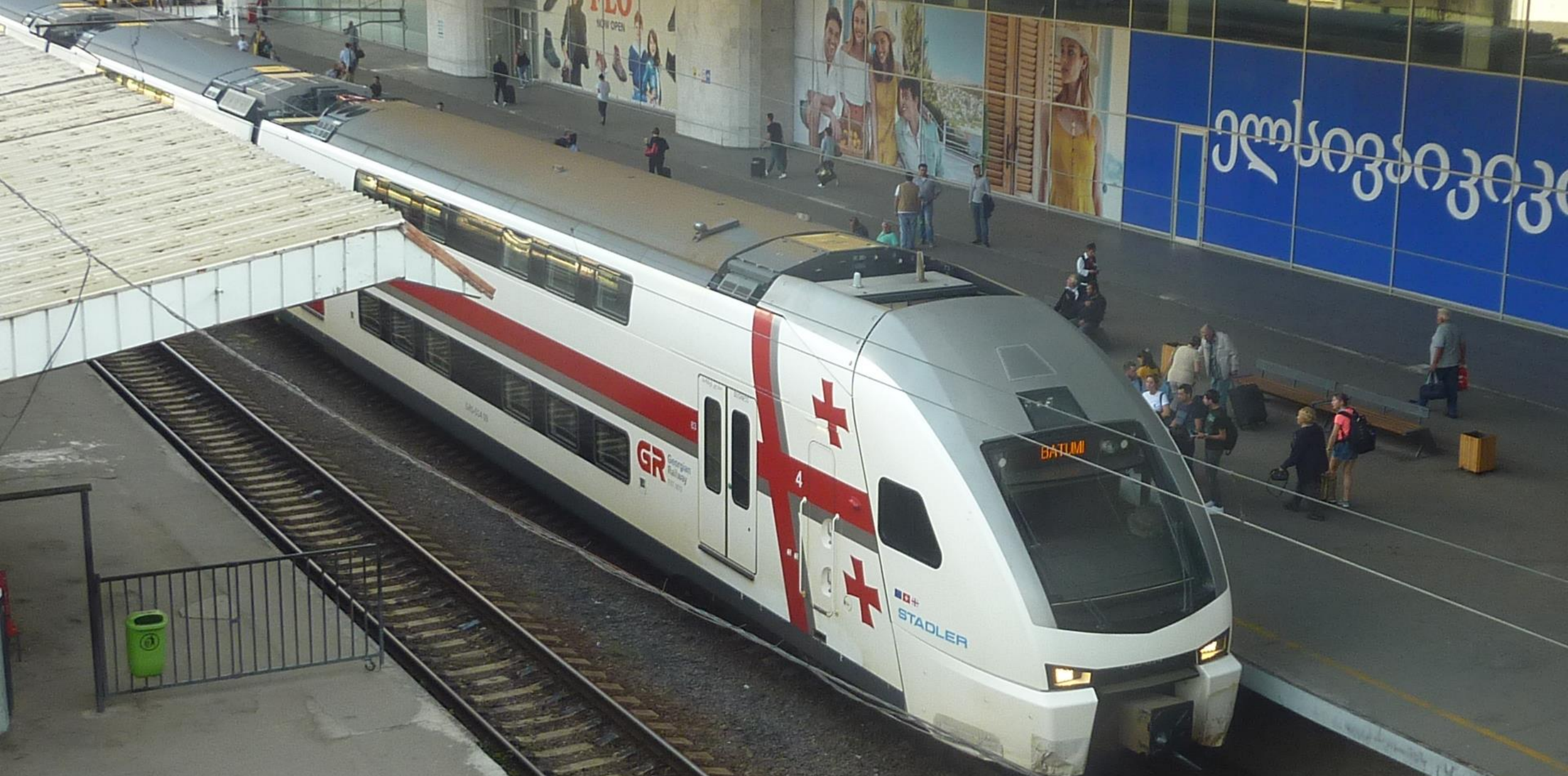
Modernes Bahnfahren (1): IC von Tiflis nach Batumi: doppelstöckige Stadler-Züge „KISS“