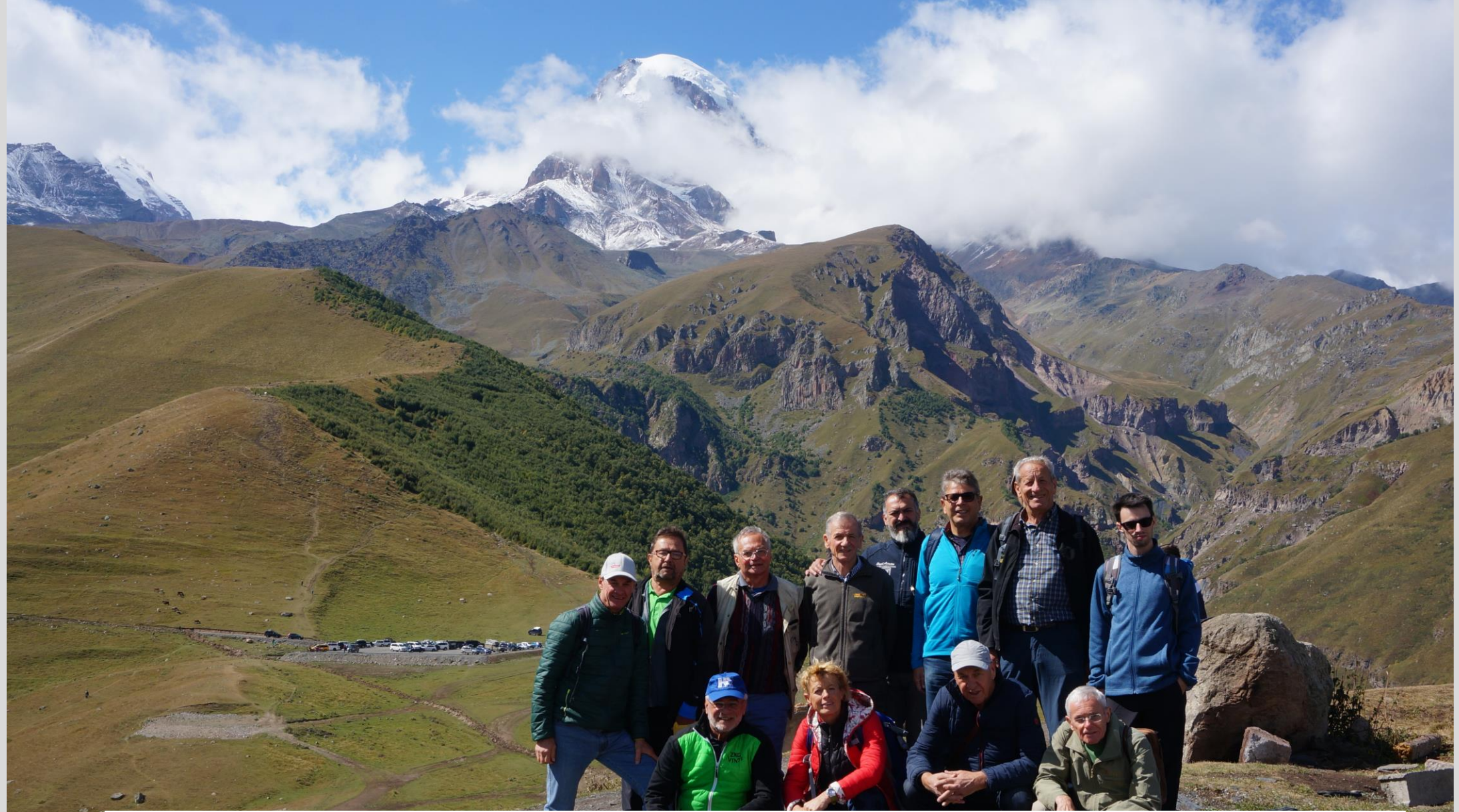
Ausflüge und Transfers mit Kleinbus: zum Kazbeg (5033 m) im Nord-Kaukasus