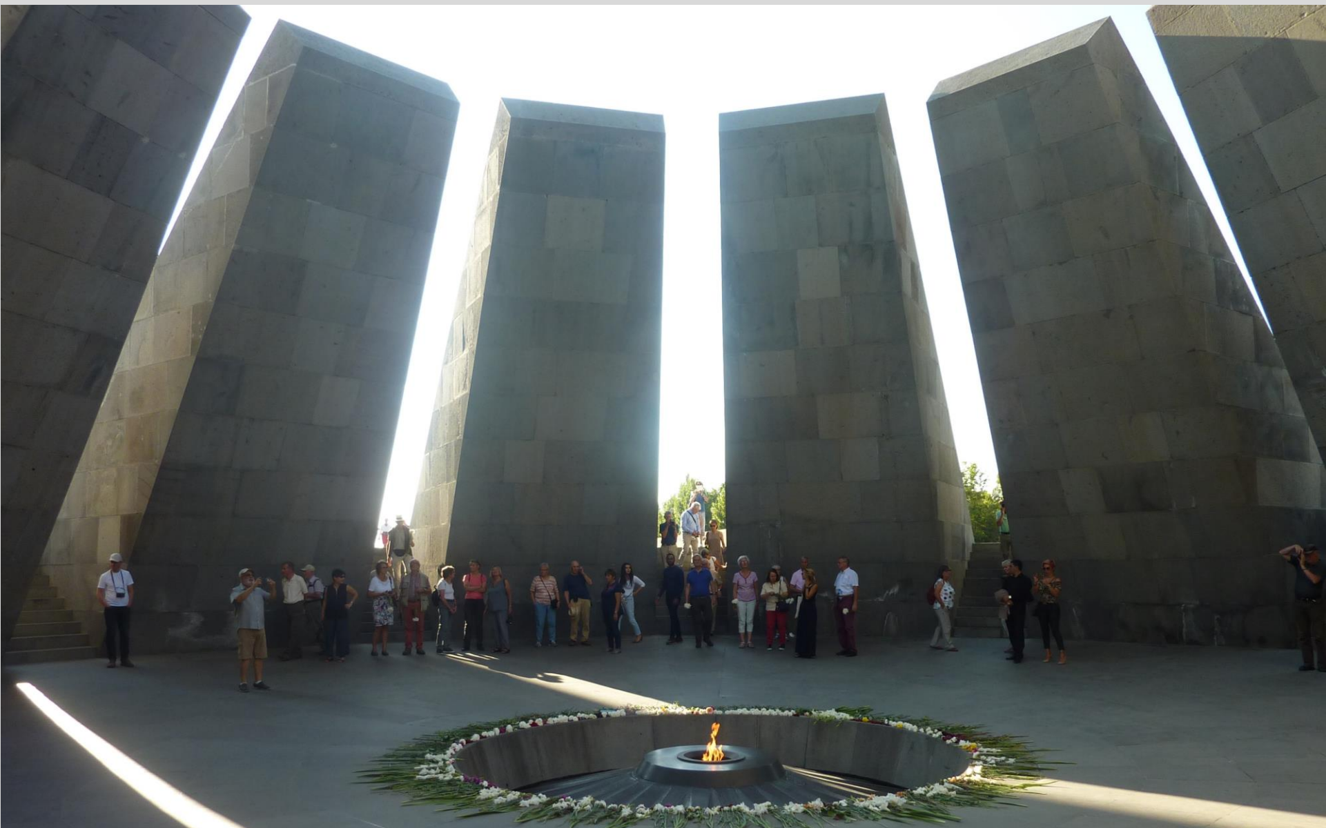
Geschichte und politische Verhältnisse: Völkermord-Mahnmal und –Museum in Yerevan, Armenien