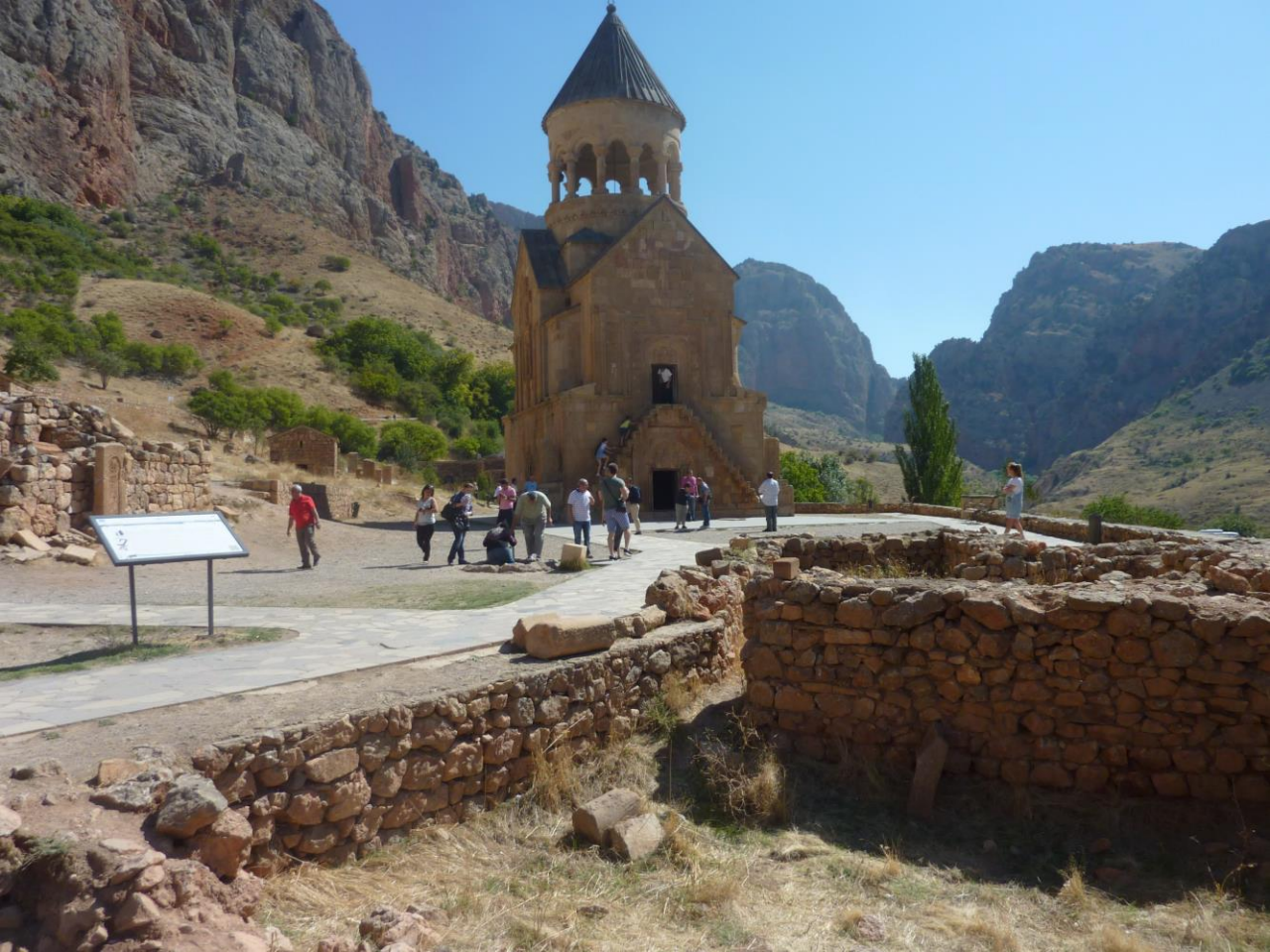
Ausgefeiltes Kulturprogramm (5): Balanceakt im Kloster Noravank. Armenien