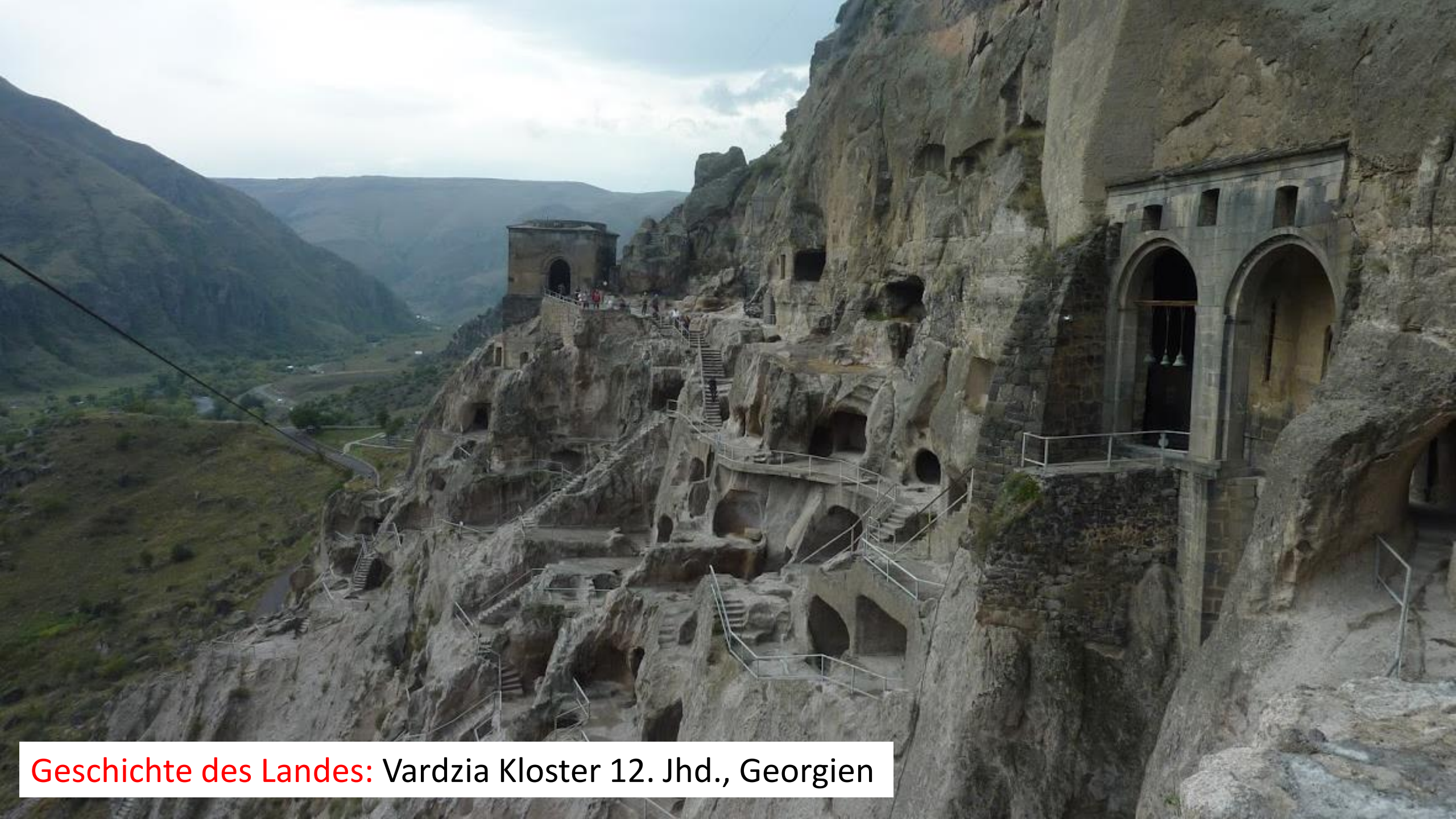
Geschichte des Landes: Vardzia Kloster 12. Jhd., Georgien